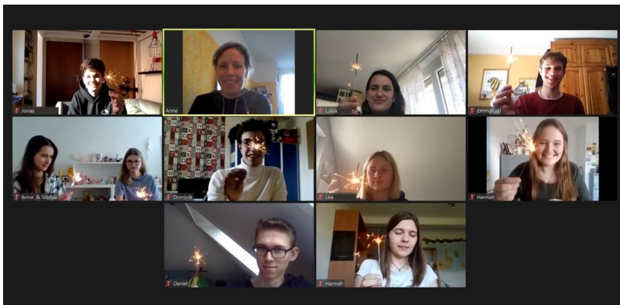
(Un moment avec des cierges magiques à la fin du séminaire)

Bien qu'il ne se passait qu'en ligne, le premier séminaire intitulé « Le Monde et moi » était un grand succès. Les MaZ commencèrent à se connaître et s'intéressèrent aux thèmes globaux comme des structures de pouvoir et du commerce ainsi que la réflexion critique de la coopération au développement et du service volontaire. Le dîner de pizza ensemble, un jeu de piste numérique et la messe en ligne faisaient partie des grands moments du séminaire.