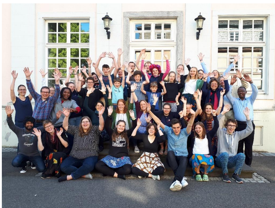
(Rencontre de la Pentecôte à Knechtsteden)

Nous sommes très content.e.s déjà maintenant !