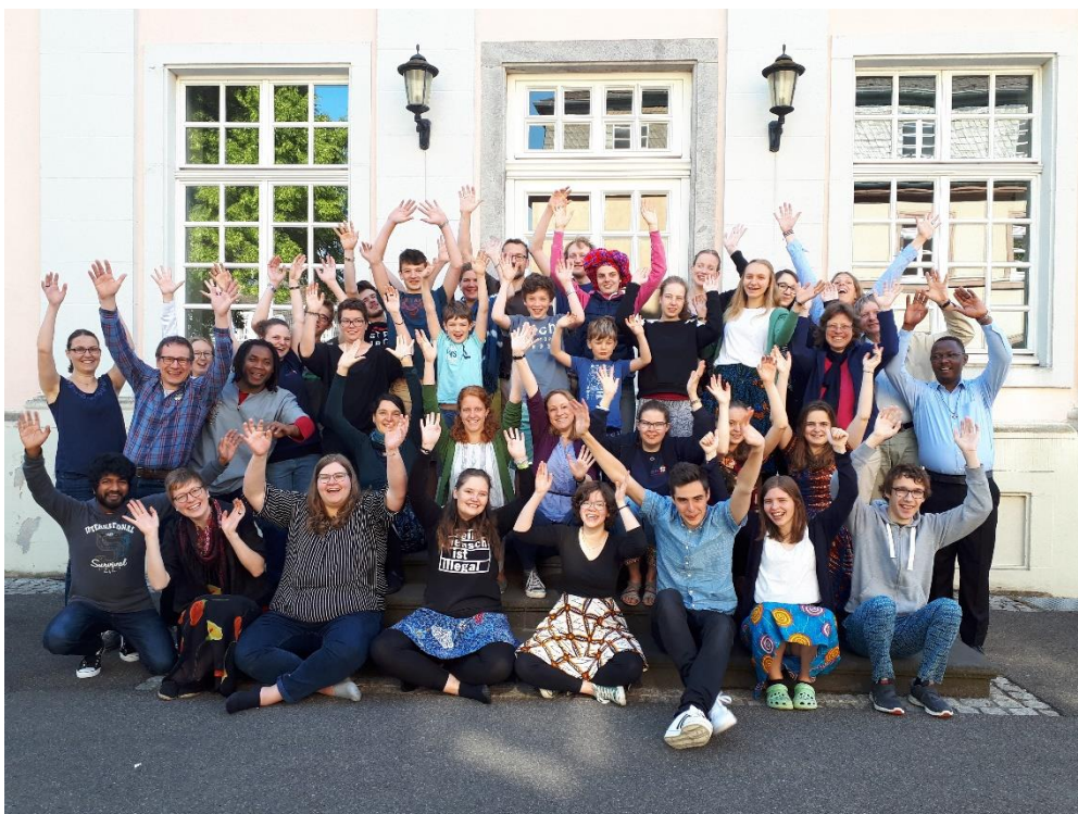
El encuentro de MaZ, Pentecostés 2019